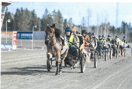
Elever på travskolan

Hästhotellet har gjort det möjligt för flera barn och ungdomar att få sina första egna ponnyer och denna lösning med helinackordering har varit mycket populär.