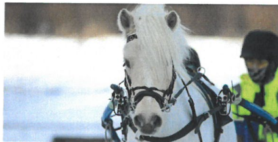
Travskolans ponny Losta Ozzy.

Av de ordinarie eleverna vi haft i år har det varit 76 tjejer och 28 killar som deltagit, och i ålder skiljer det hela 69 år mellan den äldsta och yngsta kursdeltagaren vi haft.