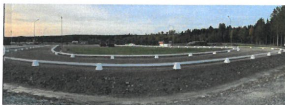
Gnyfaris anläggning.